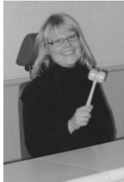
Notaari harjoittelee nuijimista istuntosalissa

Notaarivuoden parasta antia ovat tietenkin prosessinjohto ja omat istuntopäivät. Notaareille jaettavat jutut eivät ole kovinkaan laajoja tai hankalia, mutta myönnettyjen ratti-juopumusten lisäksi on toki kaikenlaisia muitakin asioita käsiteltävänä ja ratkaistavana. Vaikka istuntoja varten pyrkii valmistautumaan kaikkiin mahdollisiin väitteisiin ja tilanteisiin, tulee aina kuitenkin eteen jotain uutta ja yllättävää.