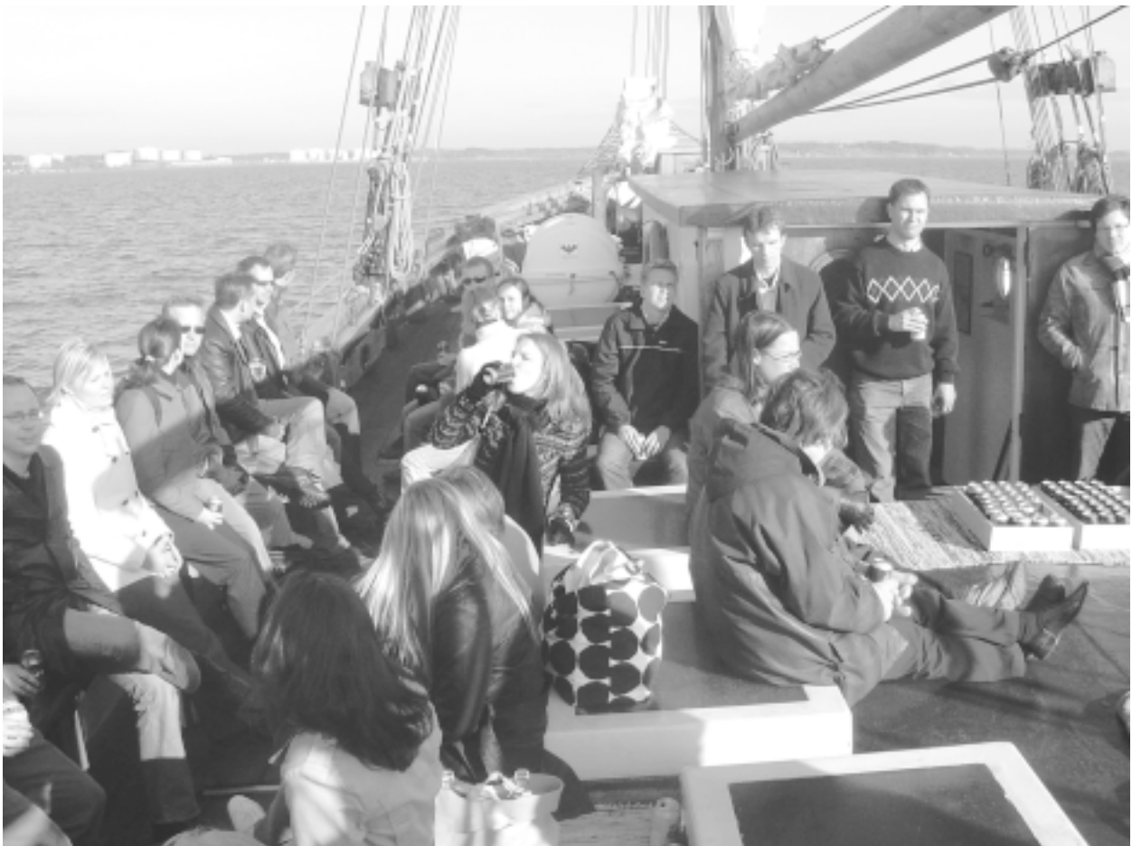
Halkolaiturista on juuri irtauduttu ja kokka suunnattu kohti itää.

Merelle siis päästiin orastavasta ruokaepisodista huolimatta. Sitä paitsi, kuten kaikki penkkiurheilijat hyvin tietävät, ”lähellä ei ole mukana”. Heti alusta alkaen runsaat valikoimat olutta, siideriä, lonkeroa ja viiniä herättivät suurta ihmetystä. Oli sanomattakin selvää että nestetasapainon vajauksesta ei tulisi kärsimään illan aikana kukaan. Ensimmäiset kaljat oli toki korkattu jo laiturissa hyvissä