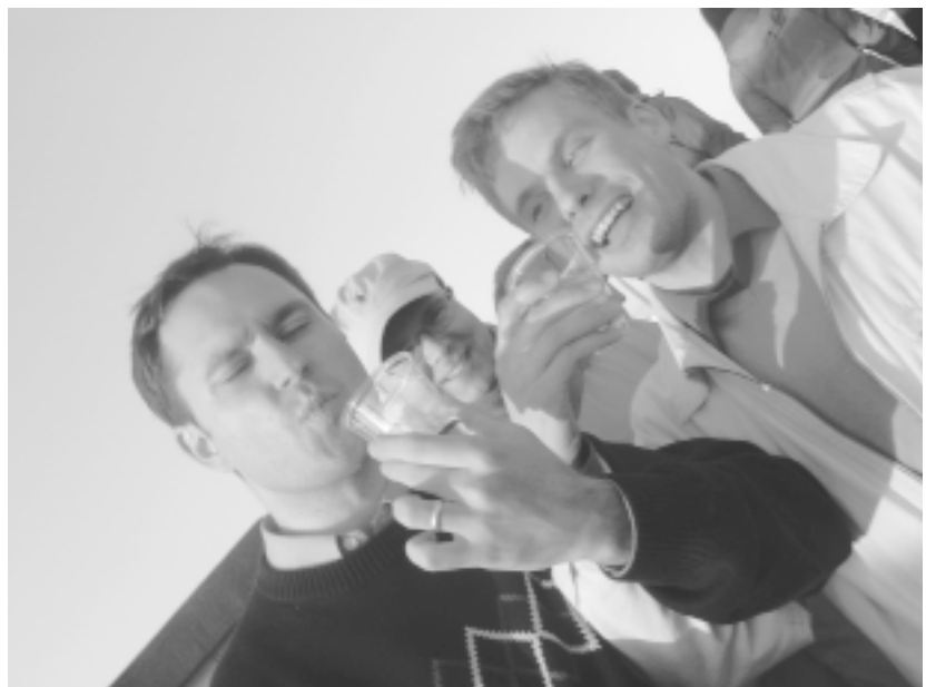
Snapsejakin oli tarjolla...

Kirjoittaja (alakuvasssa oikealla) on Nuoret Lakimiehet ry:n hallituksen Jäsentapahtumavastaava 2005.