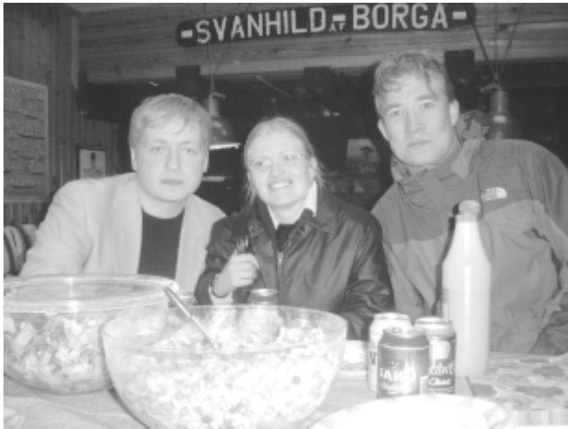
Ruokailemassa Svanhildin kajuutassa.